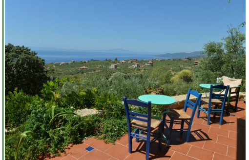
Wie wäre es mit einem Frühstück auf der Sonnenterrasse?