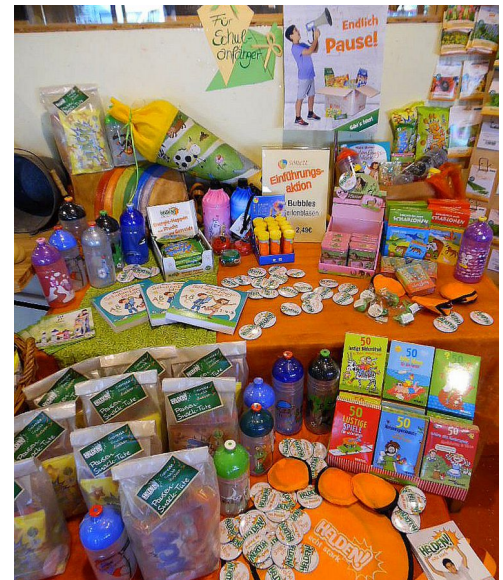
Fair & Quer Schulanfänger-Tisch

Mitte September beginnt die Schule. Für manche ist es der Beginn einer neuen Zeit. Wir wünschen allen Schulanfängern einen guten Start! Fair & Quer hat alles für die Schultüte im Sortiment. Bei uns finden Sie leckere gesunde Snacks und kleine Naschereien. Seifenblasen und Rätselblöcke, Hefte, Stifte, Wassermalfarben und vieles mehr.