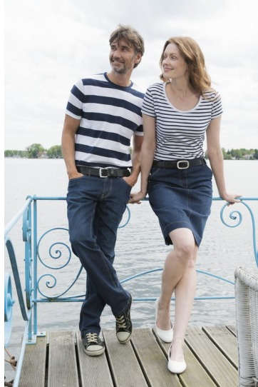
GOTS-zertifizierte T-Shirts aus 100 % Bio-Baumwolle von Livingcrafts.

und eine Stofftasche von Livingcrafts zum Sonderpreis von je 11,90 € und 9,90 € an. Solange der Vorrat reicht.