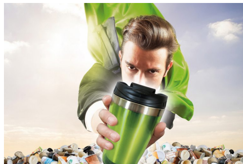
Werden Sie ein Becherheld!

Es ist höchste Zeit umzudenken. Bei uns können Sie Ihr Heißgetränk in Ihren Mehrwegbecher einfüllen lassen. Die „Fair-To-Go“-Abgabe entfällt und zusätzlich erhalten Sie einen Preisnachlass von 10 Cent – so kostet Ihr Kaffee 20 Cent weniger und Sie sind ein Becherheld.