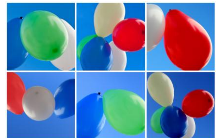
Ballonflugwettbewerb für Groß und Klein mit tollen Preisen – am 29. Juni um 16 Uhr in Wieblingen/Adlerstraße 1.